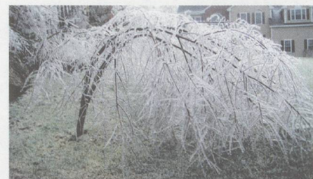
«Swinging the birches»: Im Eissturm biegen sich Birken, bis sie den Boden berühren.

Ein Streifblick über die freie Zürcher Szene: Konzerte mit dem Harry White Trio, dem Ensemble Cattrall und dem Mondrian Ensemble (Dezember 2011)