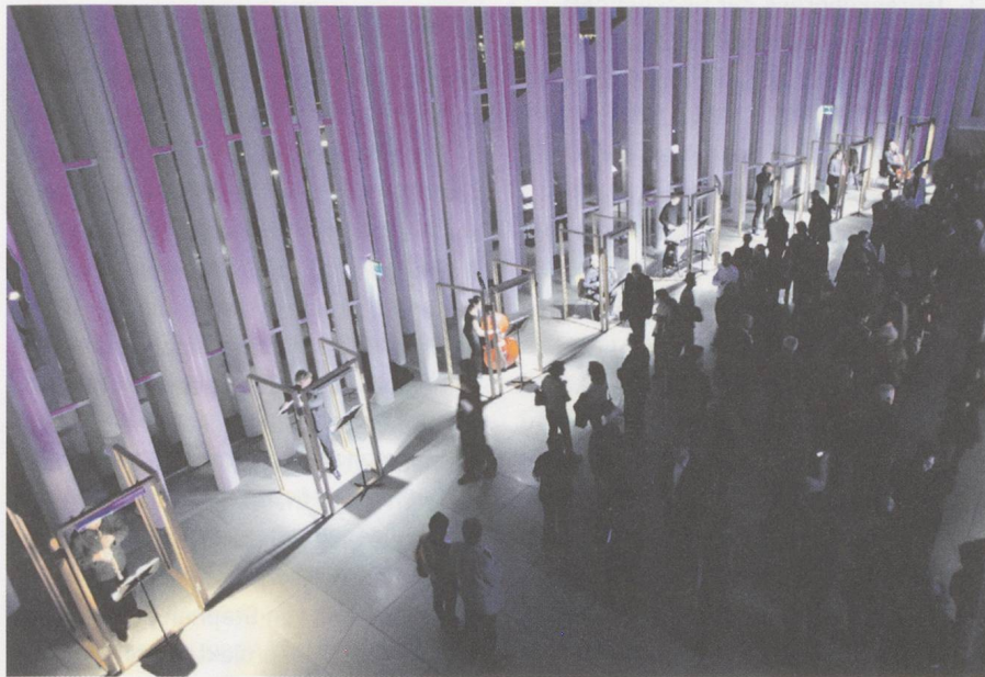
Die «Collection Serti» aus Patrick Corillons «Oskar Serti va au concert. Pourquoi ?»

Das Luxemburger Festival rainy days (25. November bis 4. Dezember 2011)