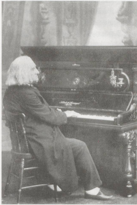
Franz Liszt am Klavier, Weimar 1885.

Liszt-Tage der Hochschule für Musik Basel: Internationales Symposium, Konzerte, Vorträge und weitere Veranstaltungen zu Franz Liszt (2. bis 4. Dezember 2011)