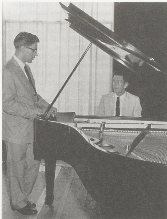
1958 an den Darmstädter Ferienkursen: David Tudor und John Cage (am Flügel).

Wie auch immer: Sein Auftritt hatte Folgen. Die Begriffe «Aleatorik» und «Indetermination» wurden zu gewichtigen