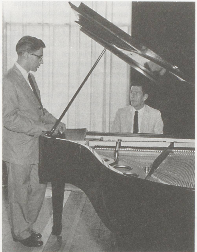
1958 an den Darmstädter Ferienkursen: David Tudor und John Cage (am Flügel).

Wie auch immer: Sein Auftritt hatte Folgen. Die Begriffe «Aleatorik» und «Indetermination» wurden zu gewichtigen