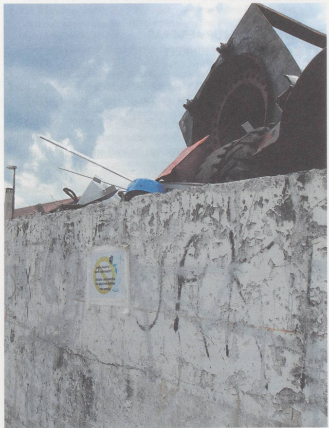
Bern, Gewerbeareal Galgenfeld, Libellenweg.

Nach dem Scheitern der Verhandlungen ergab sich für BeJazz, dem traditionell wichtigsten Veranstalter für die Berner Jazzszene, überraschend eine neue Chance zu einem eigenen Club in Form einer Kooperation mit dem Stadttheater Bern. Dieses plante just damals die Inbetriebnahme einer neuen Spielstätte in Berns Nachbargemeinde Köniz. Der in Umnutzung begriffene Gewerbekomplex Vidmar bot ausreichend Platz für eine zeitgemäss ausgestattete Theaterbühne. Aufgrund der trotz guter