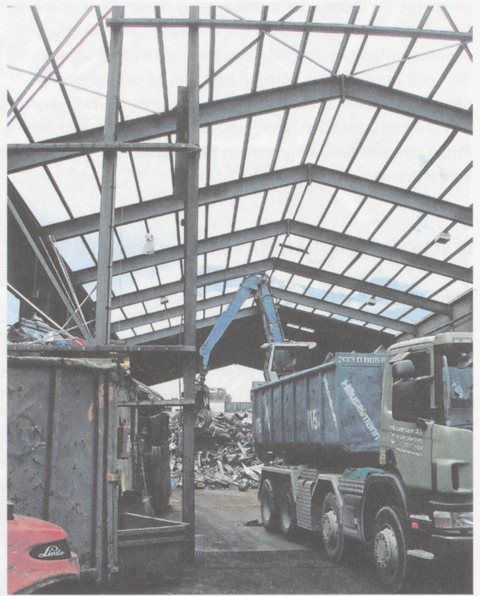
Bern, Gewerbeareal Galgenfeld, Libellenweg.

Das ist grundsätzlich nicht schlecht für junge Musiker, die so in ungezwungenem Rahmen experimentieren, sich künstlerisch entwickeln und Spielpraxis gewinnen können. Andererseits ist solche Spielkultur auch kontraproduktiv, denn sie schafft Probleme hinsichtlich der Wahrnehmung des kreativen Musikschaffens durch interessiertes Spartenpublikum. Was sich aus naiver Perspektive als blühende Musikszene deuten lässt, entpuppt sich bei näherem Hinsehen als institutionalisi-