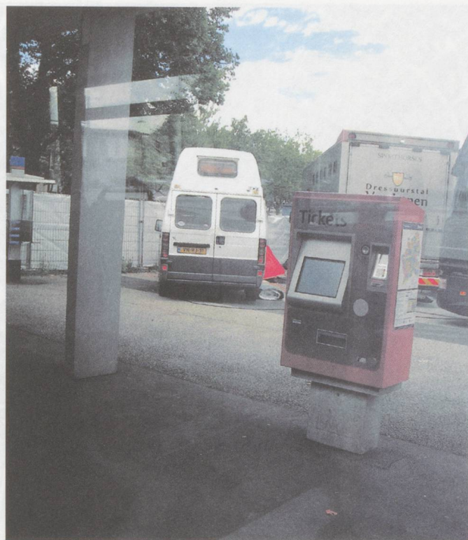
Bern, Tramhaltestelle Guisanplatz.

Neben dem ökonomischen Druck sind lokale Tradition, Ausgehverhalten einer vom Leben in der Provinz formatierten Klientel, Topographie, kulturpolitische Prioritätensetzung sowie Animositäten unter wichtigen Akteuren von vorrangiger Bedeutung. Diese Schlüsse legt eine Bestandesaufnahme der Berner Jazzszene nahe, die ich 2007 nach einigen bewegten Jahren kulturpolitischer Arbeit gemacht und in Form einer Karte visualisiert habe (vgl. Abb. S. 22). Die seither zu beobachtenden Entwicklungen fügen sich in die Logik der