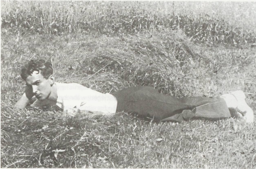
Igor Markevitch, Corsier, Anfang der dreissiger Jahre.

das Ergebnis eines Erkenntnisprozesses war. Bezeichnenderweise dirigierte er oft und gern Haydn, dessen Musik dem genau Hineinhörenden von der Freude daran erzählt, selbst ein Erkenntnisprozess zu sein.