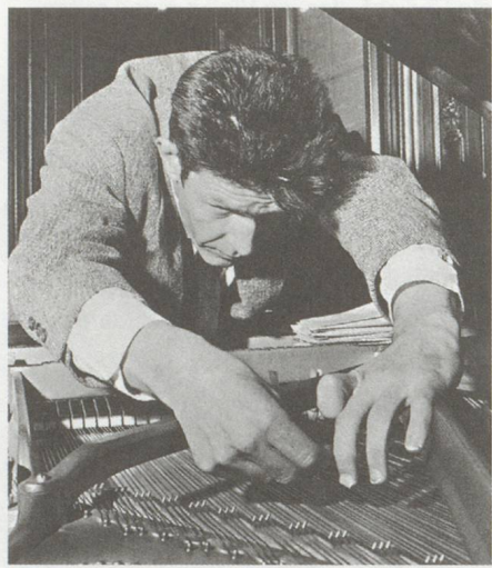
John Cage präpariert einen Flügel, 1940.

Festival Cage@Klee, im Zentrum Paul Klee, Bern (30. Juni und 1. Juli 2012)