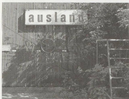
Eingang zum Klub ausland an der Lychener Strasse 60 in Berlin.