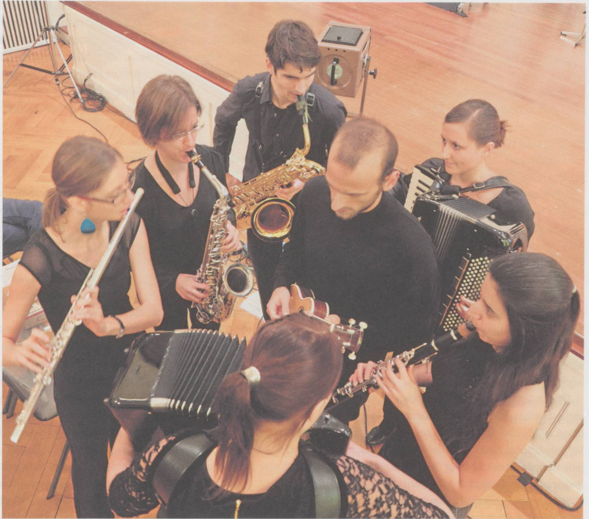
«zone expérimentale», das Ensemble des Masterstudiengangs Contemporary Music der Hochschule für Musik Basel bei einer Aufführung von Dieter Schnebels «Zwischenstücken» im November 2012.

Schweizer Hochschulraum für Forschungsprojekte und Dozenturen offen.