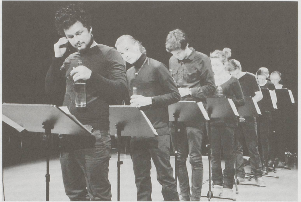
HKB-Semesterpräsentation des Studiengangs Musik und Medienkunst «à suivre #22», Januar 2013.

Voraussetzungen, an Komponisten wie Interpreten, hat wiederum die Entwicklung der zeitgenössischen Musik im Laufe der letzten 100 Jahre mit sich gebracht, begonnen bei analytischen Ansätzen und neuen Spieltechniken, über das Denken, Dialogisieren und Arbeiten jenseits von Fachgrenzen, bis hin zur Kenntnis elektroakustischer Phänomene und Funktionsweisen. Entsprechend den spezifischen Anforderungen formulieren die Zürcher Hochschule der Künste, die Hochschule für Musik Basel, die Hochschule der Künste Bern und die Hochschule Luzern ihre Ausbildungsziele in Werbebroschüren. Im Bereich Bachelor of Arts (B.A.) ist immer wieder die Rede von Grundlagen, reflektiertem Lernverhalten und selbständigem Arbeiten, seltener fallen Stichworte wie Urteilsfähigkeit oder Interpretationskonzept. Alles ist hier ausgerichtet auf den Erwerb fundamentaler praktischer und theoretischer Kompetenzen, die für den späteren Werdegang möglichst viele Türen offen halten. Und auch hierin sind sich alle einig: «Der Bachelorabschluss ist nicht berufsbefähigend. Der Studiengang bereitet auf die Spezialisierung in einem Masterstudium vor.»