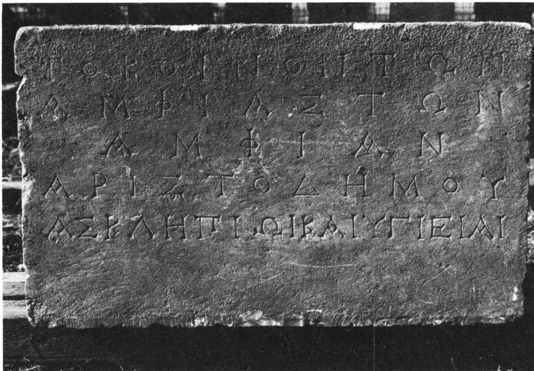
Fig. 5: La base des Amphiastes à Erétrie. Vue de face.