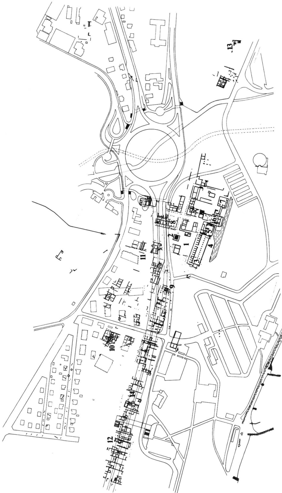
Fig. 4. — Plan général du vicus de Lousonna (état 1977).