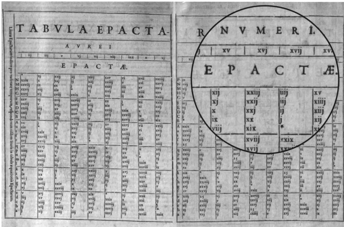
Figur 3: Tabelle zur Bestimmung der Gregorianischen Epakte aus der „Explicatio“ [Cla03, S. 110/111] unter Berücksichtigung der Sonnen- und Mondangleichungen. Die Zuordnung zwischen den Buchstaben in der ersten Spalte und den Jahrhunderten ist in weiteren Tabellen (Tabula Aequationis [Cla03, S. 112ff]) festgelegt.