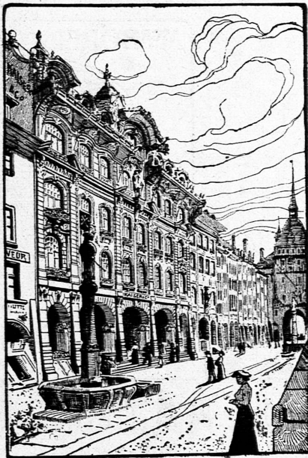
Nouveaux bâtiments — Rue du Marché 39/43.

Editeurs des vues suisses pour l'enseignement de la géographie (12 tableaux) et des tableaux d'intuition pour la composition . La famille, l'école, la maison et ses alentours; la forêt, le printemps, l'été, l'automne, l'hiver.