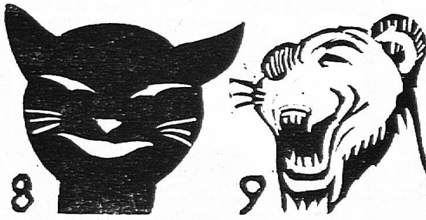
Le rire chez les animaux : Gueule fendue vers les oreilles ; yeux presque fermés.

masque de félin, Rabier a simplement fendu la bouche vers l'oreille et fermé l'œil ; et cela a suffi (fig. 9).