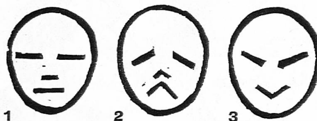
Les schémas de Superville : le calme, la tristesse et la joie.

C'est un médecin français, Duchenne , qui le premier étudia scientifiquement les expressions du visage, grâce à une circonstance exceptionnelle : on sait que les muscles se contractent quand on y fait passer un courant électrique ; mais ce courant produit sur le visage des douleurs si atroces que le patient ne montre