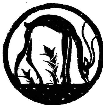
Fig. 14. Interprétation de la gazelle. (Cristal de Prenosil, Genève.)