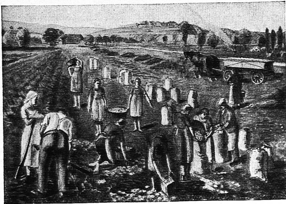
Groupe : L'homme, le sol, le travail. Peintre : Traugott Senn, Berne.