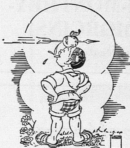
Chic!... du POMDOR CIDRERIE JYVERDON

Transports en Suisse et à l'étranger. Concess. de la Sté Vaud. de Crémation