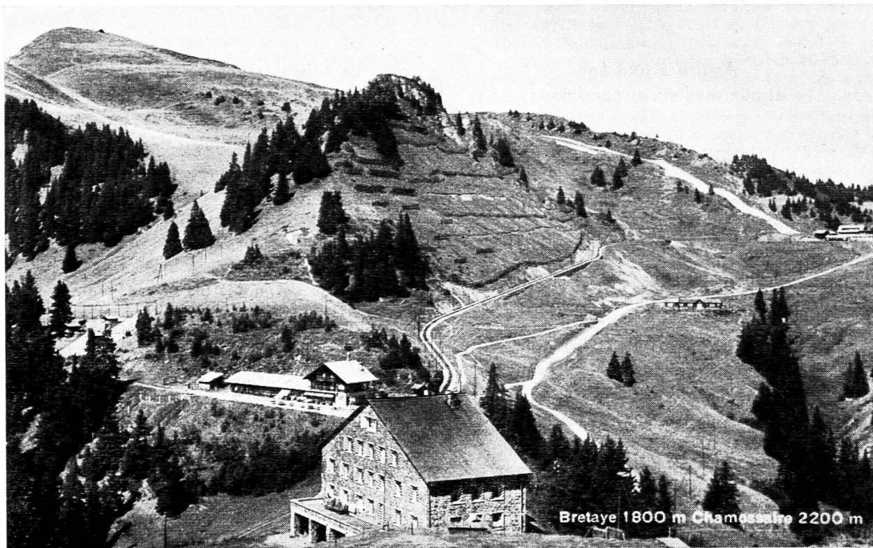
Maison militaire de Bretaye

Rédacteurs responsables : Educateur, André CHABLOZ, Lausanne, Clochetons 9; Bulletin, G. WILLEMIN, Case postale 3, Genève-Cornavin. Administration, abonnements et annonces: IMPRIMERIE CORBAZ S.A., Montreux, place du Marché 7, téléphone 6 27 98. Chèques postaux II b 379 PRIX DE L'ABONNEMENT ANNUEL: SUISSE FR. 13.50; ÉTRANGER FR. 18.- • SUPPLÉMENT TRIMESTRIEL: BULLETIN BIBLIOGRAPHIQUE