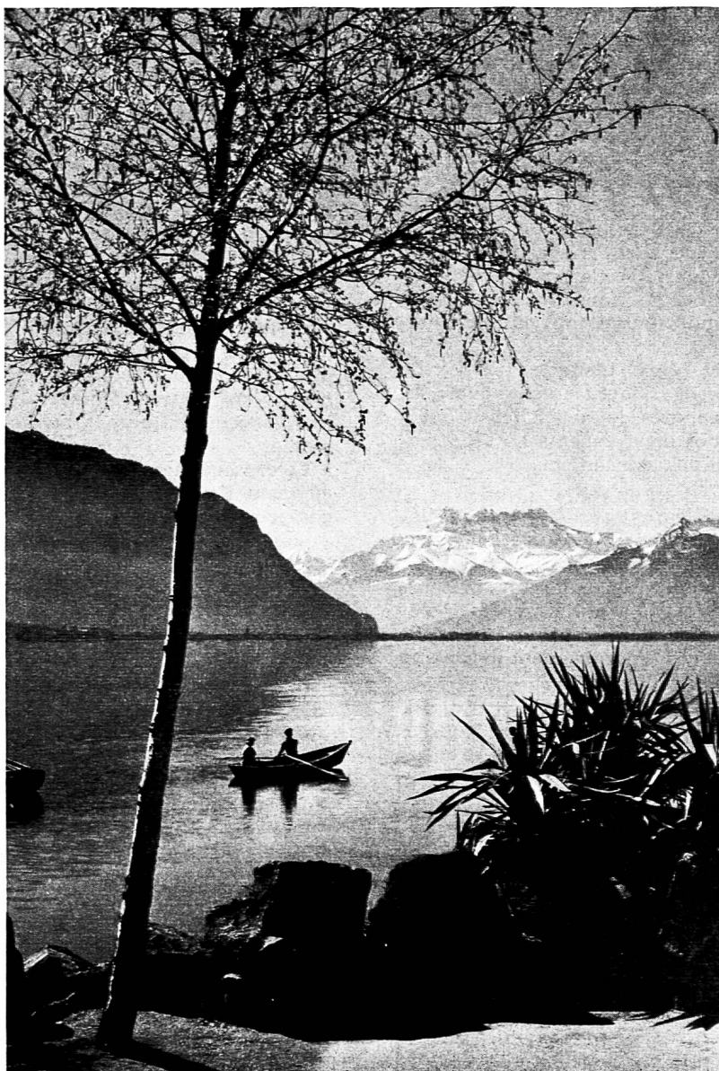
Quai de Montreux-Territet