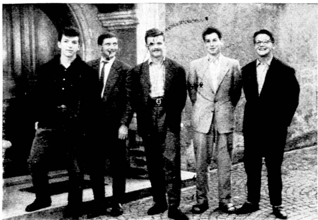
Fig. 1. Communauté des élèves de l'Ecole normale. Les cinq premiers présidents. La communauté « consomme » beaucoup de présidents ; cette charge ne doit pas aboutir à créer un sous-directeur. Aussi le président est-il remercié à chaque Assemblée générale pour les services rendus. Il est néanmoins rééligible. (Photo Ed. Guéniat, 3.10.58.)

ses termes par l'Assemblée générale de la communauté, de quel esprit s'inspire la nouvelle organisation. La part que nous avons prise, personnellement, à la rédaction de la constitution, est des plus réduites ; nous avons assisté à une séance de Conseil général (provisoire) pour y délimiter les secteurs pouvant être confiés au discernement des élèves et éviter ainsi tout chevauchement sur nos prescriptions réglementaires. Puis... nous avons brûlé l'estrade, pour nous servir de l'expression de C. Freinet, et ce fut à été pour nous feu de joie : ah ! que l'estrade flambait bien ! Car, à vrai dire, le système reposant sur la discipline hétéronome, même assoupli, par lequel nous avons dirigé l'Ecole jusqu'à ce jour, ne nous avait jamais donné pleine satisfaction. Aussi avons-nous peu à peu, au cours des ans, préparé le terrain à un changement de la conception même de la conduite de notre séminaire, et cela par une évolution confiante vers les méthodes de culture morale actives. L'éclosion de notre communauté est donc un aboutissement, et non un point de départ nouveau plus ou moins imposé. « Le point de rencontre, nous écrit C. Freinet après avoir pris connaissance de cette innovation, dans la clairière, de toutes les pistes où nous sommes laborieusement engagés pour aller vers un peu plus de lumière, un peu plus de civisme, une plus grande liberté dans la dignité du devoir accompli. »