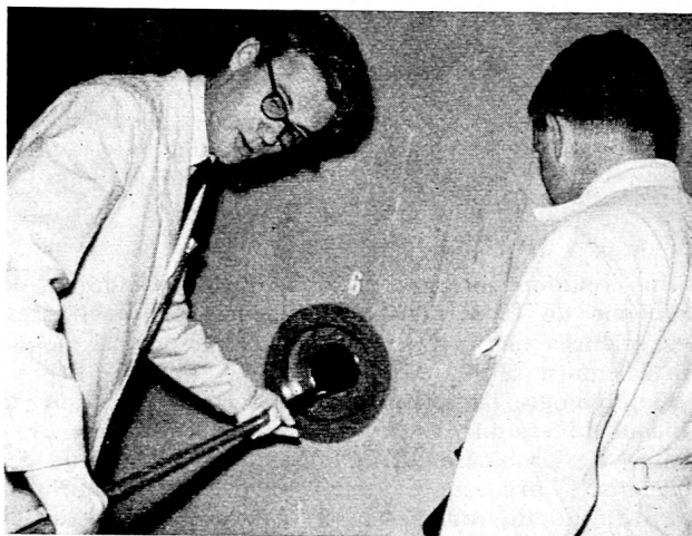
Un étudiant du Poly de Zurich travaille ici au réacteur Saphir, il procède au défournement d'un isotope d'un des canaux d'irradiation.

métallurgistes doivent savoir préparer l'uranium, le plutonium, le béryllium, le zirconium et, avec les chimistes, ils apprennent à traiter les barreaux d'uranium usés afin d'en séparer le plutonium de l'uranium non encore utilisé, ainsi que les déchets de fissions. Les chimistes doivent savoir fabriquer de l'eau lourde et du graphite ultra pur, de même qu'ils doivent appliquer les techniques d'introduction par réactions chimiques des traceurs radioactifs dans de nombreux corps pour les besoins de l'industrie et de la recherche.