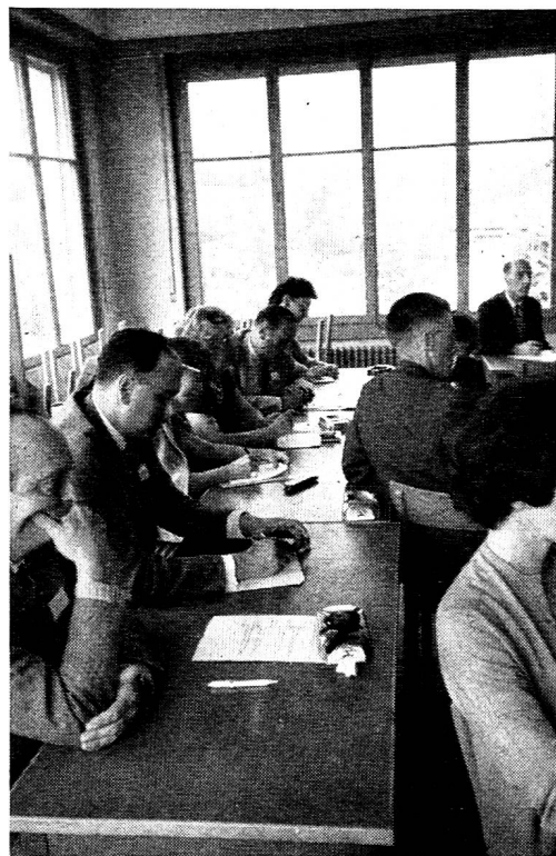
Même les Genevois savent écouter...