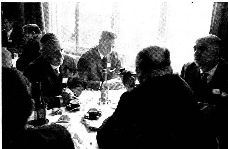
Quand se prennent les grandes décisions...

pas suffisamment clairs ou enfin citèrent leurs propres expériences pour mieux marquer certaines limites, ou projeter de la lumière sur des affirmations qui rejoignaient leurs préoccupations.