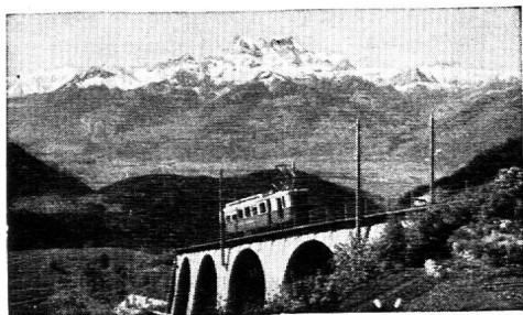
Aigle-Leysin en 30 min.

tous les livres neufs et d'occasion et tous les livres d'école