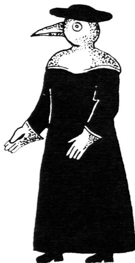
Costume du médecin: le bec du masque était rempli de substances aromatiques destinées à purifier l'air.

Ces marrons seront longtemps les professionnels de la peste. Malgré leur dévouement pour les malades et les morts, malgré les risques qu'ils courent, ils encaisseront souvent plus de critiques que d'éloges ou de florins. Fabri ne leur accorde que deux qualités: saleté et ignorance. Ils ont plus ou moins droit aux dépouilles des décédés, lorsqu'on ne les brûle pas; ils ne se gênent pas de se servir à l'avance, dit-on. En 1542, s'ébauche un service médical, à Lausanne et Vevey, par la désignation d'un chirurgien des pestiférés — c'est un barbier, les deux termes sont alors synonymes — puis d'un médecin. Mais, tandis que le médecin n'entre pas en contact avec ses malades, formulant à distance diagnostic et ordonnances, le chirurgien portera en fait tout le poids des soins aux pestiférés. C'est lui qui fait les saignées, ouvre les bubons, panse les charbons; seul le marron est en contact aussi intime avec les patients.