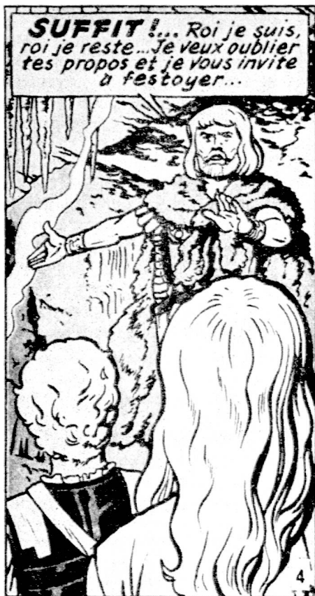
Fig. 4 : Martin « Iorix le Grand » Castermann Ed.

nière devient ambiguë pour la raison que les gestes et les attitudes peuvent être interprétés de plusieurs façons. Parmi plusieurs « possibles », la parole détermine un seul « certain ».