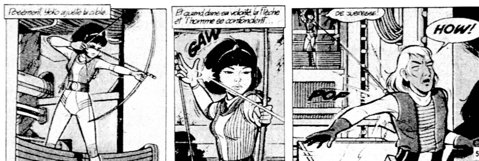
Fig. 5 : Leloup « La forge de Vulcain » Dupuis Ed.

3 e image : le résultat ; l'homme est touché. C'est l'effet. Le trajet de la flèche est supposé, localisé entre les deux images.