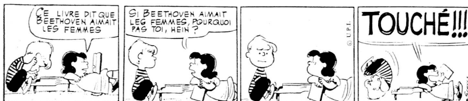
Fig. 6 : Schulz « Peanuts » UPI Ed.

Un discours trop long peut être parfois intégré de manière plus astucieuse sous la forme, par exemple, de coupures de journaux.