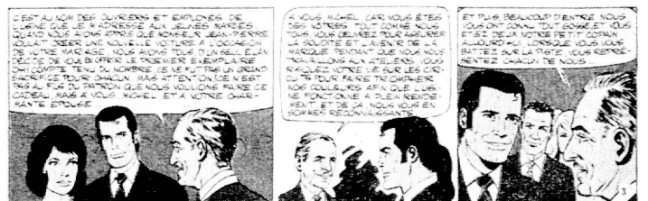
Fig. 3 : Graton « Des filles et des moteurs » Dargaud Ed.