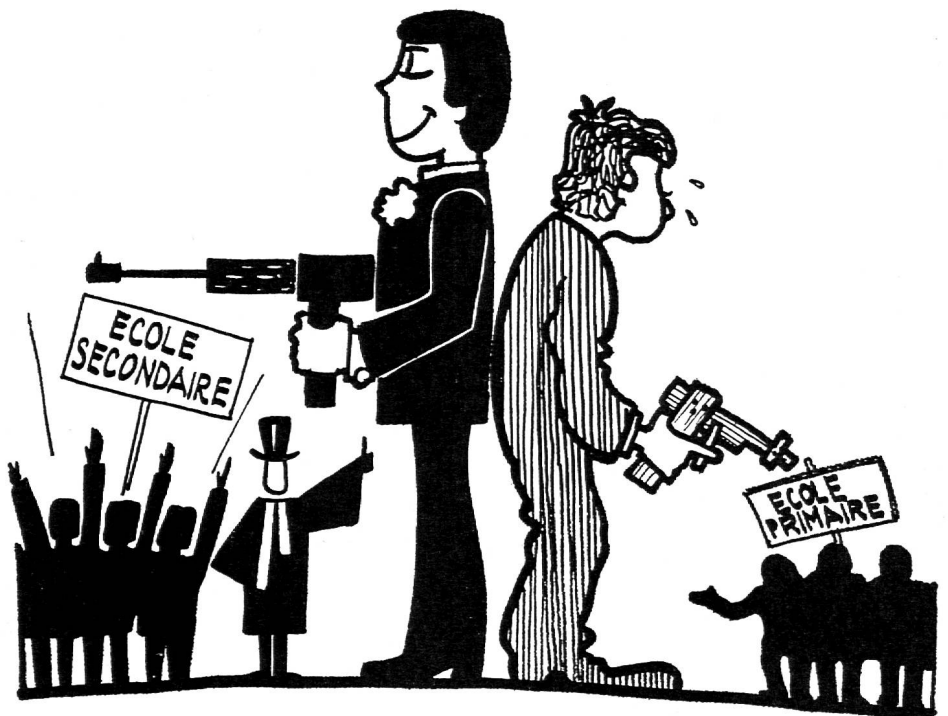
Dessin de NOMIS.