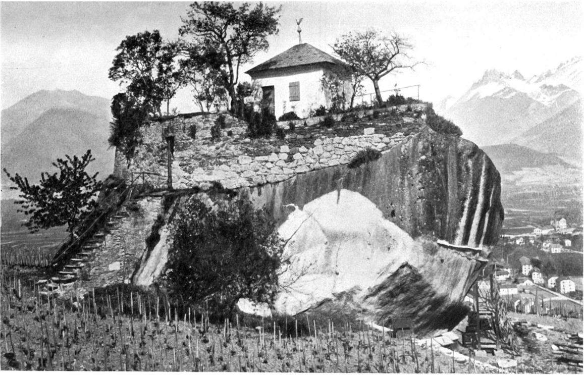
Pierre des Marmettes. 1824 m 3 .