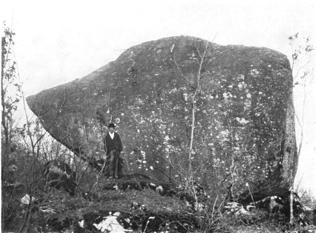
Fig. 1. Pierre des Muguets. ca. 1000 m 3 Oberhalb Monthey. Sur Monthey