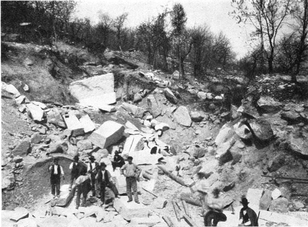
Phot. H. Sch. 1907.