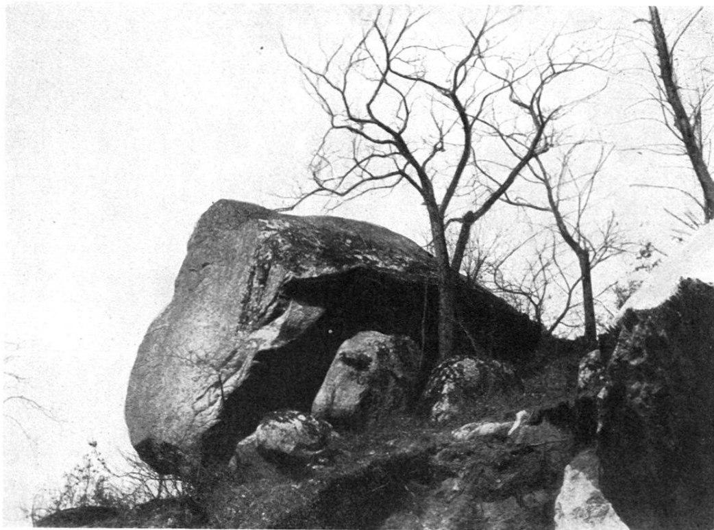
Fig. 1. Pierre à Dzo. ca. 300 m 3 .