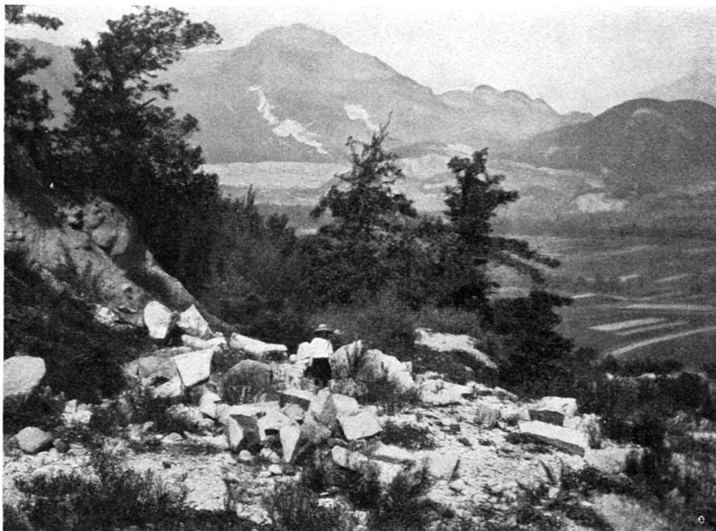
Phot. H. Sch. 1908.