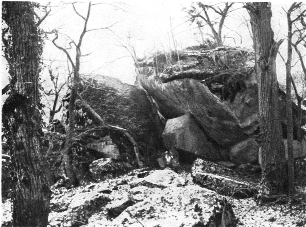
Fig. 1. Pierre à Milan. ca. 1000 m 3 .