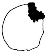
Fig. 20. Grain de glauconie coiffé de pyrite. Gr. 50. Niveau 29. Coupe mince M 49.

La glauconie contient, à l'état d'inclusions, surtout du quartz et de la pyrite, celle-ci très fréquemment. Les inclusions de pyrite ont surtout l'allure de fines granulations, rarement de gros grains. Il existe toute une catégorie de grains où la pyrite se montre d'une façon très constante, on peut qualifier les grains de glauconie dont il s'agit, de grains coiffés de pyrite. Les grains de pyrite constituant le ou les chapeaux sont inclus en partie et plus ou moins profondément dans la glauconie, leur diamètre ne dépasse pas mm. 0,05. Les grains à chapeau de pyrite sont fréquents dans les niveaux 27, 29, 31; on les trouve sporadiquement dans chaque niveau. Le mode de liaison de la pyrite avec la glauconie est variable; dans le cas le plus compliqué, le grain de pyrite semble se prolonger par des languettes dans le grain de glauconie. Dans la grande majorité des cas, le contact de la pyrite et de la glauconie est franc, et ne présente pas d'altération, cependant une légère auréole jaune est visible