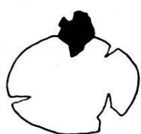
Fig. 19. Grain de glauconie coiffé de pyrite. Niveau 27. Gr. 50. Coupe mince M 48.

7. Rapport de la glauconie avec les minéraux La glauconie épigénise peu de minéraux, il n'y a guère que certaines lamelles de muscovite que l'on peut rapporter à cet état.