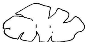
Fig. 17. Grain de glauconie lobé par fissuration. Niveau 31. Gr. 50. Coupe mince M 50.

2. Couleur. Elle est aussi très variable, passant du vert-pâle au vert-olive foncé; elle varie aussi dans un même grain, la couleur vert-pâle se trouvant au centre comme grande tache, soit en petites taches de forme plus ou moins définie. La couleur la plus fréquente est le vert légèrement jaunâtre. La couleur des grains altérés est bien connue, elle passe du jaune ou brun-pâle au brun opaque, suivant l'altération.