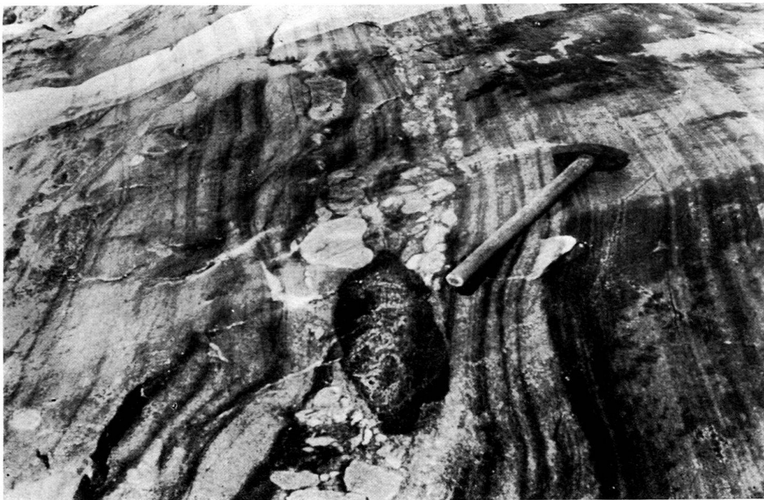
Fig. 2. Amas de blocs dans les quartzites rubannés de la formation de Sydsermilik du cycle des Kétilides.