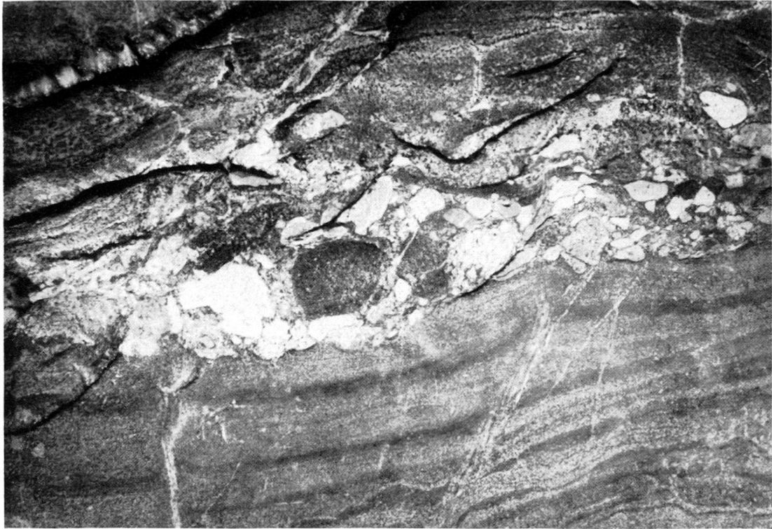
Fig. 1. Amas de blocs dans les quartzites rubannés de la formation de Sydsermilik. Rivage SE du fjord de Sydsermilik.