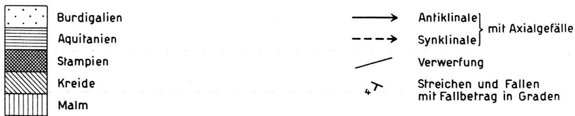
Fig. 1. Topographisch-geologische Übersichtskarte (mit Netzeinteilung nach den Blättern der Siegfriedkarte 1 : 25 000).