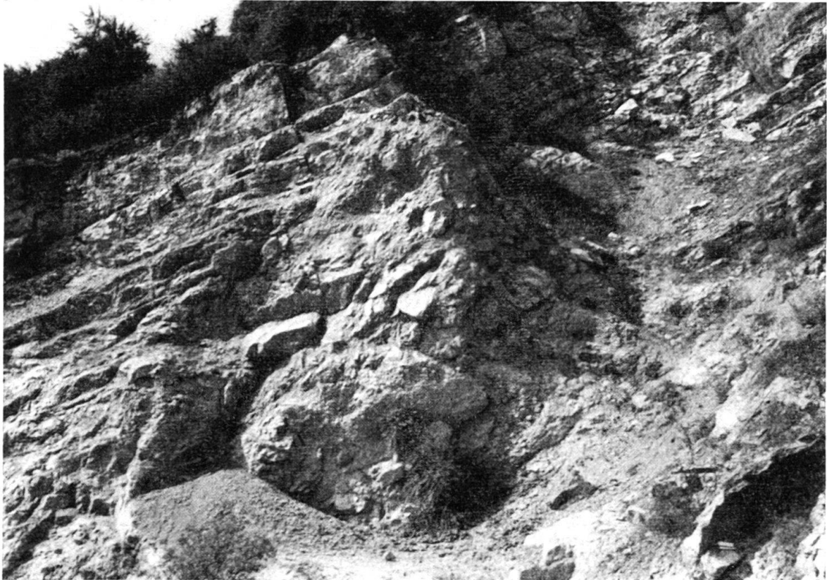
Fig. 18. Hauterivientasche im Steinbruch Rusel (TRu 3) mit einer aus Marbre bâlard-Blöcken (unten), Hauterivienmergeln und Calcaire roux (oben) bestehenden Füllmasse.

läufe erodiert worden sein (vgl. Abschnitt 2.3.3). Es ist anzunehmen, dass das Wasser vor allem auf den undurchlässigen Schichten der Goldbergformation und der Mergel- und Kalk-Zone des Berriasien zirkuliert hat. Damit überhaupt eine Wasserführung möglich war, mussten die Valanginienkalke durch Oberflächenerosion stellenweise vom undurchlässigen Mergel und Mergelkalk des Hauterivien bereits entblösst gewesen sein. Nur auf diese Weise konnte das Wasser durch ein Kluftsystem bis zur Goldbergformation, die die Malmkalke vor Verkarstung schützte, eindringen.