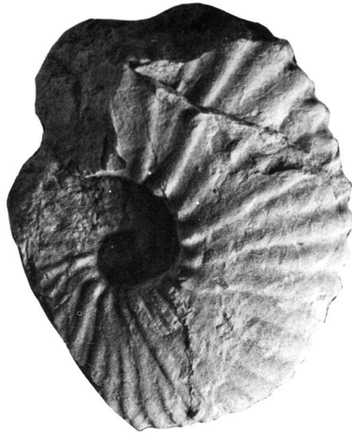
Fig. 3. Mantelliceras saxbii SHARPE, J21931, von ca. 2 m südöstlich unterhalb der kleinen Brücke über dem Ravin Le Mortruz in etwa der gleichen Schicht wie der Pachydesmoceras aff. denisonianum (STOLICZKA). Vergl. KENNEDY & HANCOCK, 1971, Taf. 79, Fig. 1.

Ebenfalls aus diesen Schichten stammt der hier beschriebene Pachydesmoceras cf. denisonianum (STOLICZKA), dessen genauer Fundort auf dem Profil in Fig. 2 eingetragen wurde.