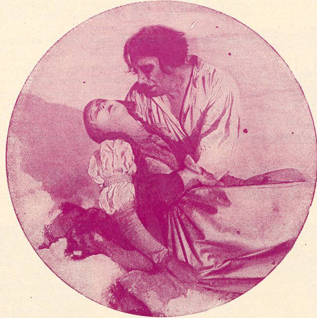
Il prend la jeune fille dans ses bras et déjà ses lèvres s'avancent vers les lèvres exangues de l'enfant, mais il sursaute, ce n'est qu'un cadavre qu'il serre dans ses bras.

Alors, il veut jeter le corps par-dessus le traîneau, mais les jambes du cadavre sont prises dans le marchepied et le corps inanimé de la malheureuse fille est traîné dans la neige à une allure folle.