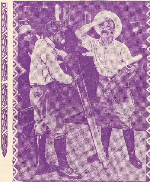
HARRY POLLARD dit „Beaucitron“ et lui-même ses films en scène.

Pour suivre à de nombreuses demandes, la direction du Cinéma-Palace nous prie d'annoncer que le plus grand super-film que les Américains nous aient donné à ce jour, Le Faucon de la mer , sera projeté en février et le grand film sur la Naissance de la Confédération suisse sera donné en exclusivité au mois de janvier. Notons que Le Faucon de la Mer a été présenté en gala à l'Orient-Cinéma, à Zurich à la presse et à Messieurs les directeurs de cinéma. De leur avis, c'est la plus belle chose que l'écran révélera au public cette saison. Milton Sils, Enid Bennet et Wallace Beery l'interprètent d'une manière absolument supérieure et la mise en scène est fabuleuse.