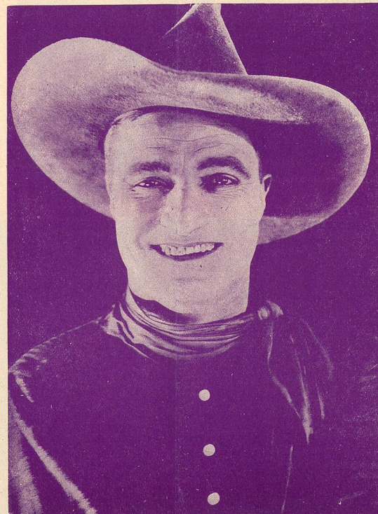
Le célèbre cow-boy TOM MIX vient d'arriver à Paris avec son cheval Tony; on lui a fait une réception des plus enthousiastes.