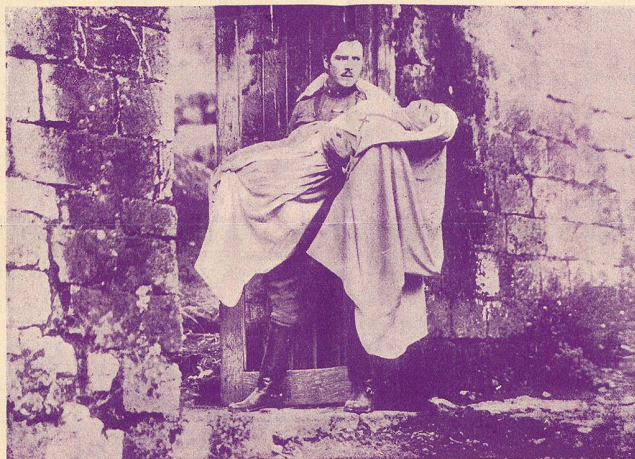
Une scène de Sœur Blanche.