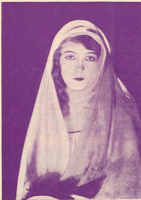
Lilian GISH dans Sœur Blanche.

Une mise en scène audacieuse et exacte entoure le drame essentiel. L'éruption du Vésuve et l'inondation d'un village, provoqué par la rupture de digues, sont des tableaux qu'on n'oubliera pas. (Cinéa-Ciné.) Ed. E.