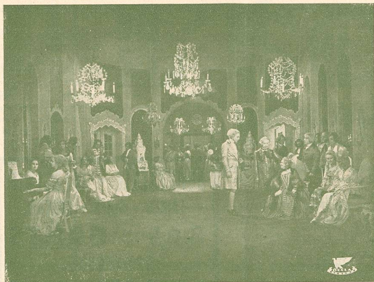
Une Scène de Cendrillon

Mme Bricoli, qui voudrait marier une de ses