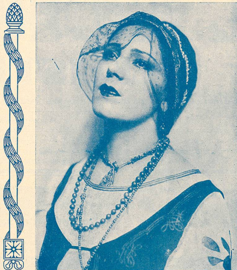
Raquel Meller dans La Terre Promise.

d'Henry ROUSSEL avec RAQUEL MELLER au Cinéma du Bourg.