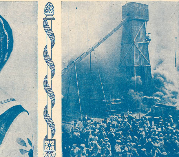
L'incendie du puit à pétrole dans La Terre promise.

Moïse Sigoulim, naguère prêteur à Scaravaloff, s'est installé changeur à Londres. Revenu au pays natal pour célébrer chez son frère, le rebb Samuel, la fête du Seder — la Pâque juive, — il y retrouve sa belle-sœur Binnah, la rabbitzine, ses nièces Esther et Lia, deux fillettes, et le fils adoptif de la famille Sigoulim, David, destiné au sacerdoce. Or, un incident banal, la chute de Lia et de David dans un champ en bordure d'une route, met Moïse Sigoulim sur la piste d'une affaire considérable de pétrole. L'odeur imprégnée dans les cheveux des deux enfants lui a révélé l'existence d'une nappe qu'il pourra exploiter grâce à un contrat préparé par lui et qui lui réserve la plus grosse part de bénéfices.