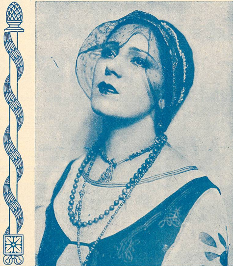
Raquel Meller dans La Terre Promise .

d'Henry ROUSSEL avec RAQUEL MELLER au Cinéma du Bourg.