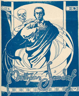
Mathias Sandorf au Royal

Je ne sais rien de plus exécrable que ces imitateurs. Si vous êtes incapable de rien produire par vous-même, n'essayez pas de briller des rayons de gloire volés à d'autres, en essayant d'imiter l'inimitable Charlie, vous n'êtes plus comique, vous êtes ridicule. La Bobine .