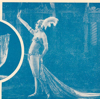
Quelques scènes du film FEUX-FOLLETS DE L'ABÎME.