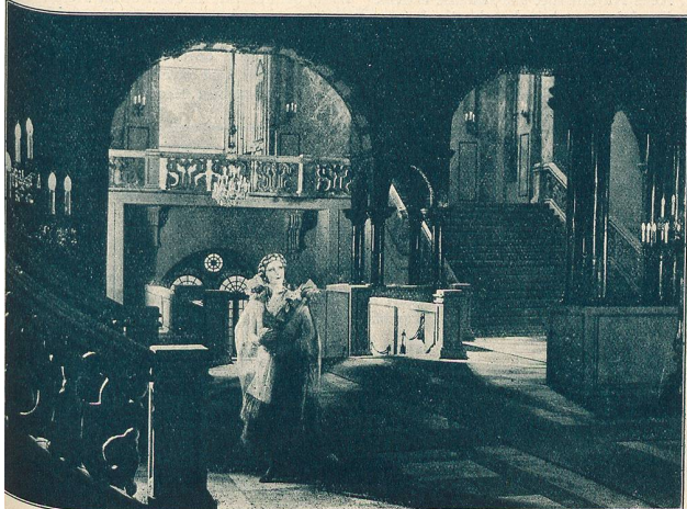
Une autre scène du film de Versailles.