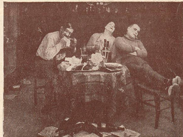
Une scène des Deux Gosses.