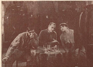
Une scène des Deux Gosses.