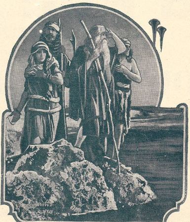
LES DIX COMMANDEMENTS passe au Cinéma du Bourg à Lausanne.

Vous passerez d'agréables soirées à la Maison du Peuple (de Lausanne).