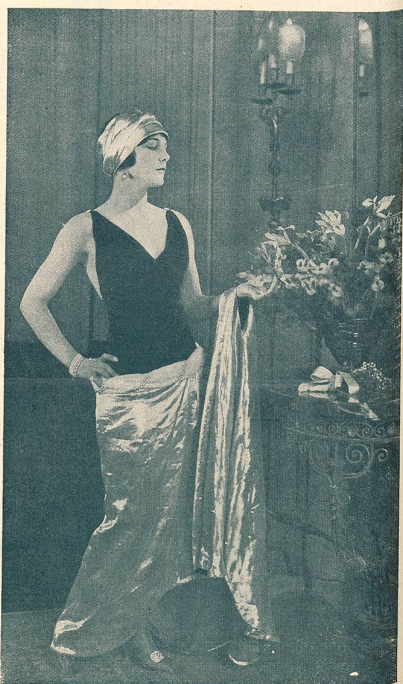
LEATRICE JOY dans LE RÉQUISITOIRE

ACHETEZ notre magnifique ALBUM des 180 Vedettes du Cinéma. Fr. 1.50 net. S'adresser à l'Administration de l'ÉCRAN, 11, Av. de Beaulieu.