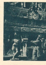
Quelques scènes du film passionnant Le Raid en Avion autour du Monde en location chez Pandora Film à Berne.