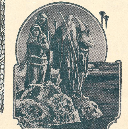
LES DIX COMMANDEMENTS passe au Cinéma du Bourg à Lausanne.

Vous passerez d'agréables soirées à la Maison du Peuple (de Lausanne).