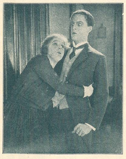
Alfred LUNT et Jobyna HOWLAND Une scène du film Dix Femmes pour un Homme.

Messieurs les loueurs de films sont invités à confier leur publicité à L'ÉCRAN ILLUSTRÉ, paraissant chaque semaine, qui leur fera un prix excessivement réduit. L'ÉCRAN ILLUSTRÉ est envoyé à tous les directeurs de cinéma de toute la Suisse et constitue un moyen de propagande aussi efficace que bon marché. Demandez notre tarif à l'administration du journal, 11, avenue de Beaulieu, à Lausanne.