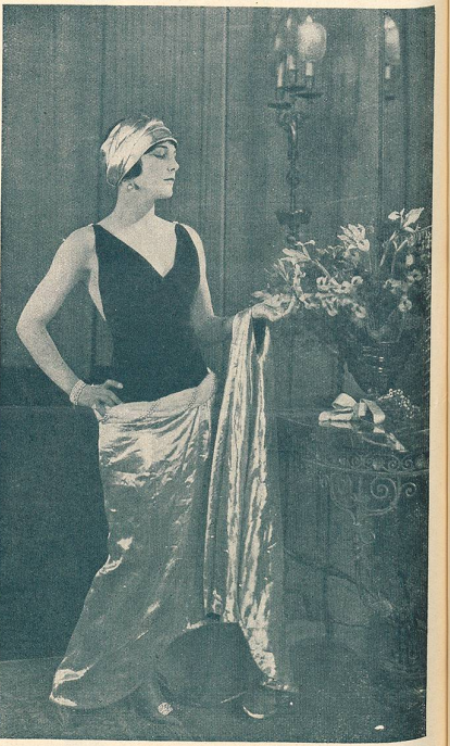
LEATRICE JOY dans LE RÉQUISITOIRE