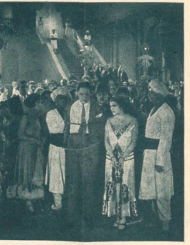
Notre Magnifique Album

L'ÉCRAN ILLUSTRÉ est en vente dans tous les kiosques, marchands de journaux et dans tous les Cinémas de Lausanne.