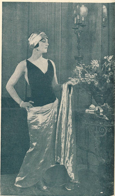
LEATRICE JOY dans LE RÉQUISITOIRE