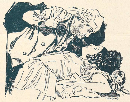
„Amours de Contrebandiers“ qui passe cette semaine au Théâtre Lumen.

Une jeune et riche Argentine Carmelita de Corloba (Pola Negri) doit épouser un non moins riche banquier de Buenos-Ayres. Lors de son voyage à Paris, qu'elle a entrepris pour acheter son trousseau, elle fait la connaissance de deux hommes. L'un très pauvre, Dudley Drake (Jack Holt), l'autre très riche et de plus, prince indien, Rao Singh (Charles de Rochefort). Elle s'éprend de l'homme pauvre et l'épouse immédiatement à l'américaine, mais le ménage ne tarde pas à lutter contre la misère. Le prince qui quette sa proie apprend que Carmelita, devenue Mme Drake a dépensé l'argent que des dames patronnesses lui ont confié pour une œuvre charitable, à titre de trésorière. Rao Singh lui offre d'acquiescer sa dette. Lorsque Carmelita veut rendre l'argent au prince celui-ci refuse et exige ce que vous pensez. Carmelita blesse le prince d'un coup de feu. L'affaire passe devant la Cour, où l'honnête Carmelita raconte toute la vérité. C'est un film Paramount.