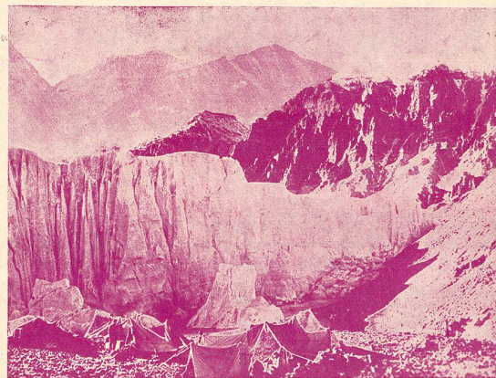
L'installation des dépôts sur le glacier Rongbuk (L'Inaccessible).