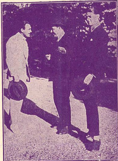
MAX LINDER pendant son séjour à Ouchy.

La direction du Cinéma Palace a le talent de varier ses spectacles et de choisir exactement ce que désire le public. C'est cet éclectisme dans les programmes de cet établissement qui fait son succès ; après Harold Lloyd, le Cinéma Palace nous donne Sept ans de Malheur , avec le génial comique français, Max Linder, un des pionniers du cinéma, le premier peut-être qui ait tourné des films comiques en France. Sept ans de Malheur est une comédie vaudeville, en 5 actes, d'une gaieté irrésistible, qui convient parfaitement au caractère de Max Linder, qui adore jouer des rôles de noctambule échoué. La scène de la glace cassée et la mimique des personnages est une trouvaille, c'est du bris de cette glace que commencent pour Max les sept ans de malheur ; une guigne persistante s'attache à lui, malgré tout ce qu'il fait pour l'éviter ; ses fiancées sont rompues, il est dévalisé par des aigrefins, ce qui l'oblige à tromper la surveillance du contrôleur des chemins de fer, n'ayant plus d'argent pour payer son billet ; attrapé, il passe au cachot une nuit inoubliable, en compagnie de détenus au voisinage douteux. Enfin nous ne pouvons raconter ici toutes les péripéties inévitables de ces Sept ans de Malheur , mais nous sommes convaincus que le public en aura pour son argent.