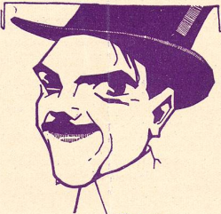
Un portrait caricature de MAX LINDER.