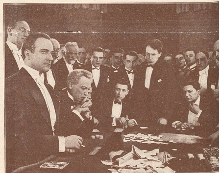
Une scène du film Le Double Amour qui passe cette semaine au CINÉMA-PALACE à Lausanne, avec Jean Angelo à gauche de l'image.

le célèbre acteur allemand que nous verrons cette semaine au THEATRE LUMEN dans le rôle du Comte Kostia .