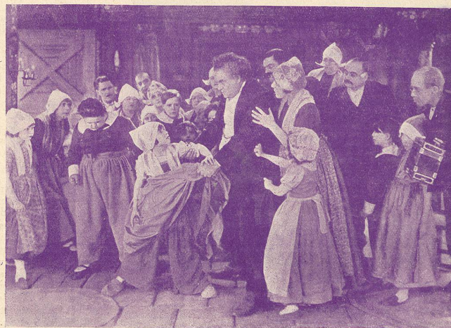
Une scène de L'Enfant des Flandres .