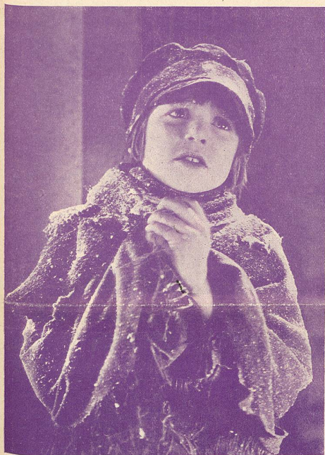
Une émouvante expression de JACKIE COOGAN dans le rôle de Nello .