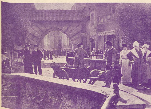
Une scène de L'Enfant des Flandres .

A l'occasion de la Nouvelle Année L'Écran Illustré exprime à tous ses lecteurs ses meilleurs souhaits de bonheur et de prospérité.